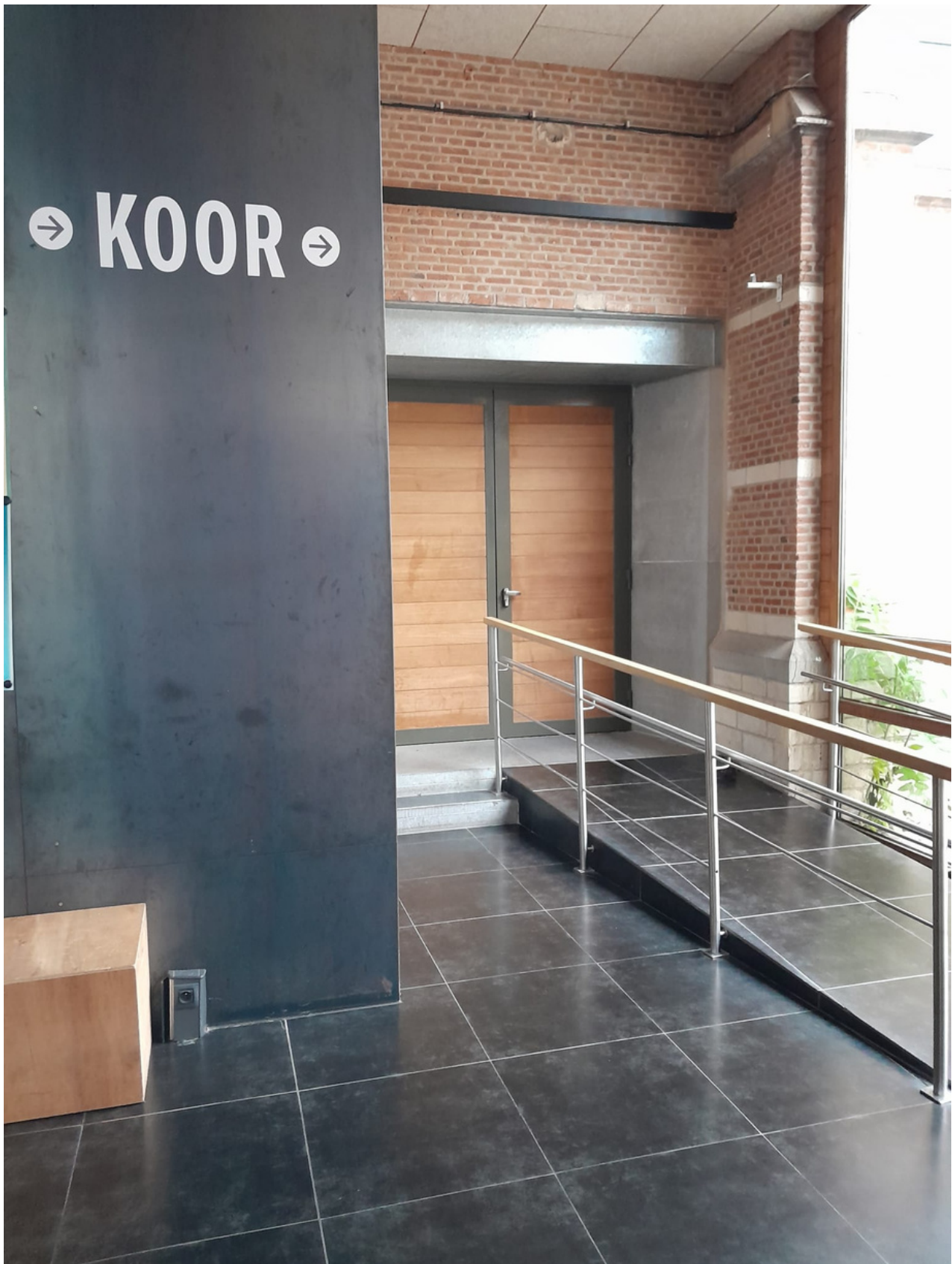
Helemaal voorin, vlak naast de ingang, vind je de deur naar het koor. Er is een oprit voor rolstoelgebruikers.