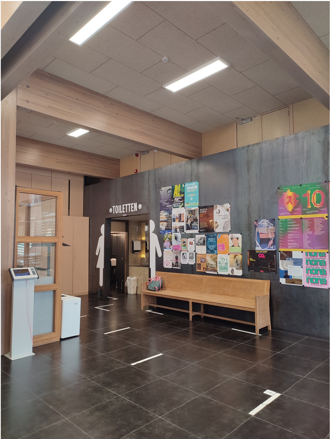
Rechts, nog voor de balie, vind je de toiletten. Er zijn in het gebouw twee rolstoeltoegankelijke toiletten, apart van deze.