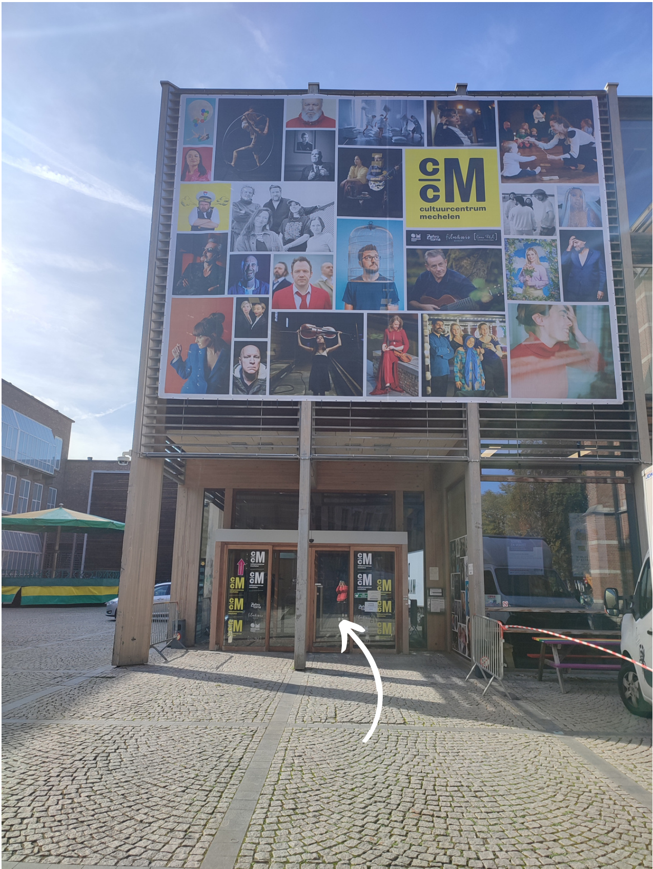
Dit is de ingang van het cultuurcentrum. De fietsenstalling zie je meteen voor de ingang wanneer je aankomt.