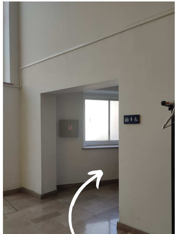
Het tweede rolstoeltoegankelijke toilet bevindt zich helemaal achterin, naast de trappen op weg naar de tentoonstellingszalen.