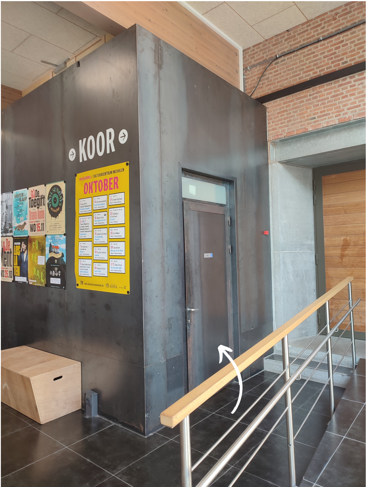
Het eerste rolstoeltoegankelijke toilet bevindt zich voorin het CCM, naast de ingang tot het koor.